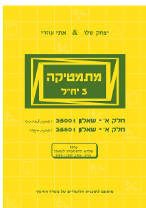
מתמטיקה 3 יח"ל חלק א' - שאלון 35001 חלק ב' - שאלון 35002