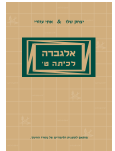
אלגברה לכיתה ט'