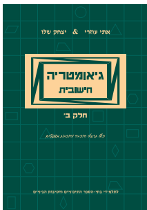
גיאומטריה חישובית חלק ב'