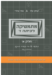
מתמטיקה לכיתה ז' חלק א'