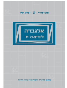
אלגברה לכיתה ח'