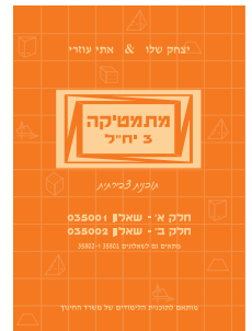
מתמטיקה 3 יח"ל חלקים א'+ב' 802/002 + 801/001