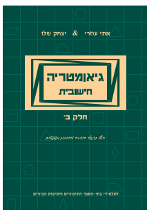
גיאומטריה חישובית חלק ב'