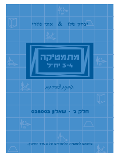
מתמטיקה 3-4 יח"ל חלק ג' - שאלון 803/003