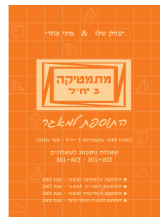
מתמטיקה 3 יח"ל התוספת למאגר 802/002 + 801/001

תוכניות לימודים מפורטות לפי הספרים באתרנו: www.mathstar.co.il