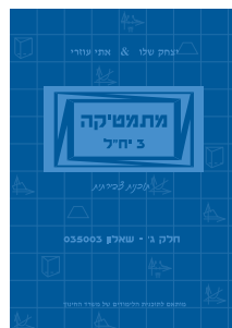
מתמטיקה 3 יח"ל חלק ג' - שאלון 803/003