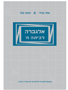
אלגברה לכיתה ח'