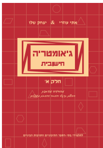
גיאומטריה חישובית חלק א'