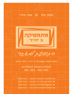
מתמטיקה 3 יח"ל התוספת למאגר 802/002 + 801/001