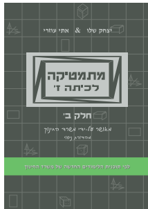
מתמטיקה לכיתה ז' חלק ב'