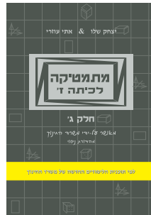
מתמטיקה לכיתה ז' חלק ג'